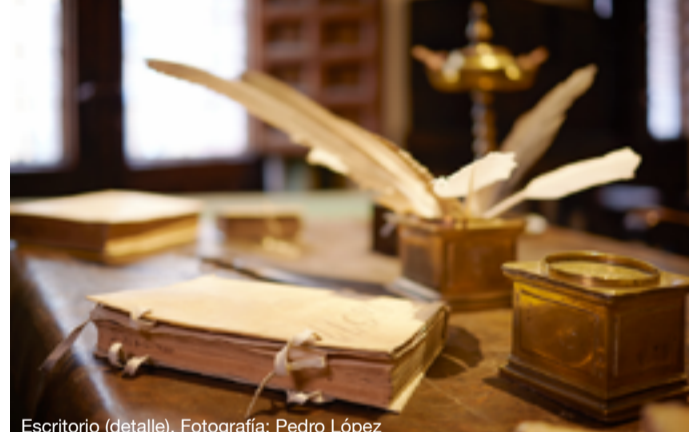
Escritorio (detalle).