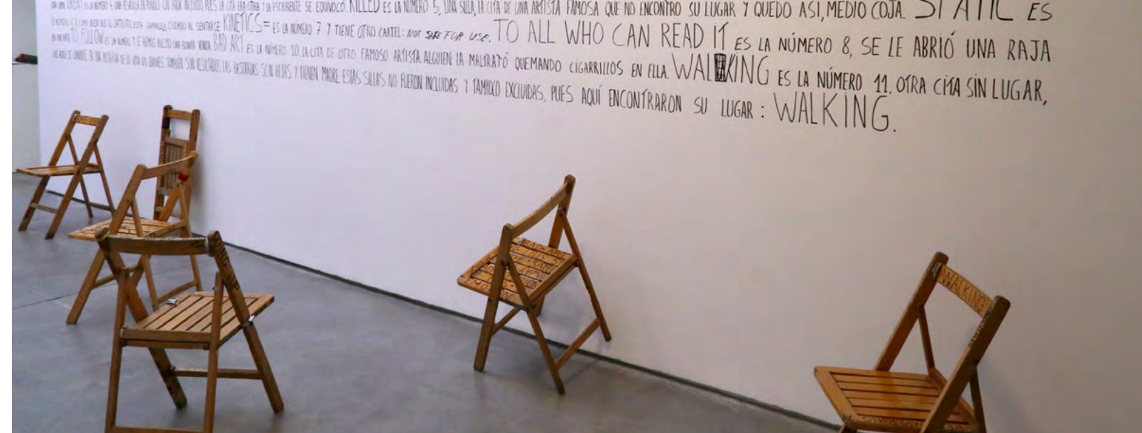
© La Ribot. Walk The Bastards , 2017. Madrid 17.

En el espacio de la Sala Alcalá 31 una selección de obras realizadas a lo largo de más de veinte años permite apreciar el trabajo particularmente singular de La Ribot. Laughing Hole (2006) abre la exposición. A la vez performance de 6 horas de duración e instalación, es emblemática por sus características transdisciplinares, que incorporan tanto danza, como performance y teatro, así como artes visuales y gráficas, todo al servicio de una experiencia colectiva fascinante e inquietante, con un mensaje político mordaz y universal. La videoinstalación Despliegue (2001) es a la vez una “retrospectiva” y una obra fundacional, ya que, por un lado, condensa los gestos y objetos que alimentaron anteriormente los ocho primeros años de Piezas distinguidas (nombre genérico del proyecto iniciado en 1993), y, por otro, inicia la práctica del “cuerpo-operador”, un método de realización en vídeo que utiliza siempre el plano secuencia y una cámara en mano.