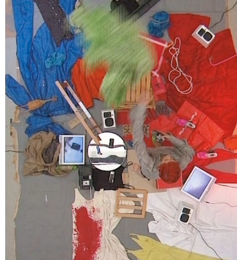
© La Ribot. Despliegue , 2001. Videoinstalación, 45 min.

Por primera vez, en A escala humana , se reúnen los tres conjuntos Walk the Chair (2010), Walk the Bastards (2017) y Walk the Authors (2018-en curso). Estas obras, compuestas por decenas de sillas plegables de madera, utilizadas después de haber servido como sillas en teatros ambulantes, están enriquecidas con citas grabadas a fuego en la madera. Los espectadores tienen que manipularlas en todas las direcciones para descifrar los textos, convirtiéndose así en los intérpretes de estas piezas participativas que invaden el espacio. Cada conjunto de sillas tiene su propia historia y orientación temática.