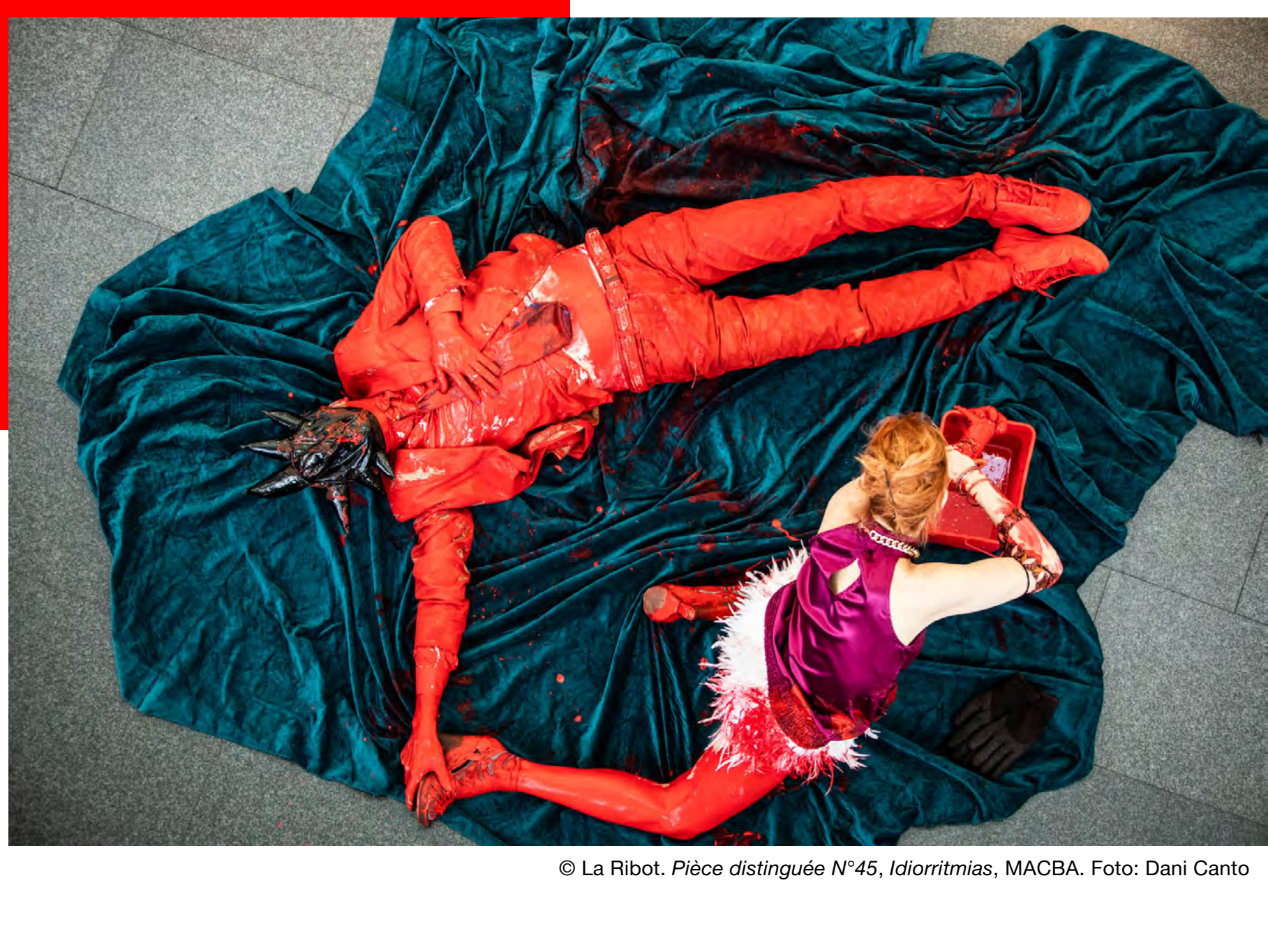
© La Ribot. Pièce distinguée N°45, Idiormitias , MACBA.