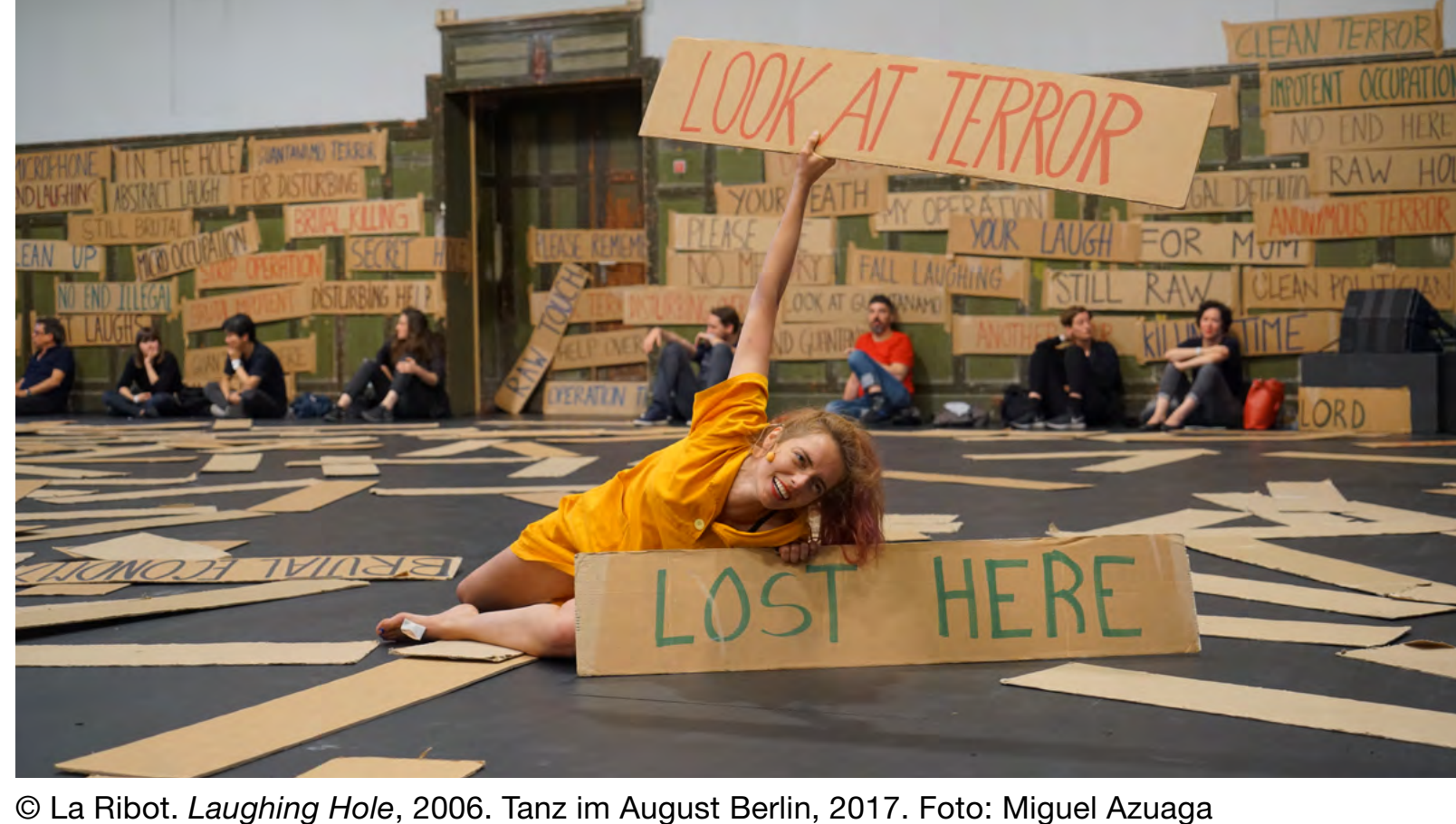
© La Ribot. Laughing Hole , 2006. Tanz im August Berlin, 2017.

A escala humana es una de las exposiciones individuales más importantes en España de la coreógrafa, bailarina y artista madrileña La Ribot. Como indica su título, la exposición subraya el papel clave que desempeña el cuerpo humano en la práctica de La Ribot: el cuerpo escenificado, el contacto entre cuerpos, la relación del cuerpo con su entorno espacial y arquitectónico, la huella del cuerpo en los objetos, la memoria de los gestos en vídeo o fotografía. La noción de escala también es determinante, ya que las obras se conciben y producen desde y con el cuerpo de la artista o de los intérpretes. Las herramientas y los accesorios, como las cámaras de vídeo, los trajes o los objetos, se utilizan en función de las posibilidades físicas del cuerpo, sin ninguna otra aportación o artificio externo. El cuerpo es así “abandonado a sí mismo”, y se expresa en toda su riqueza, especialmente a través del movimiento, el gesto, la mirada, la voz, la risa o la escritura.