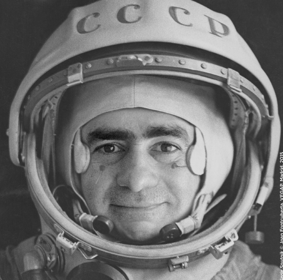
Serie Sputnik