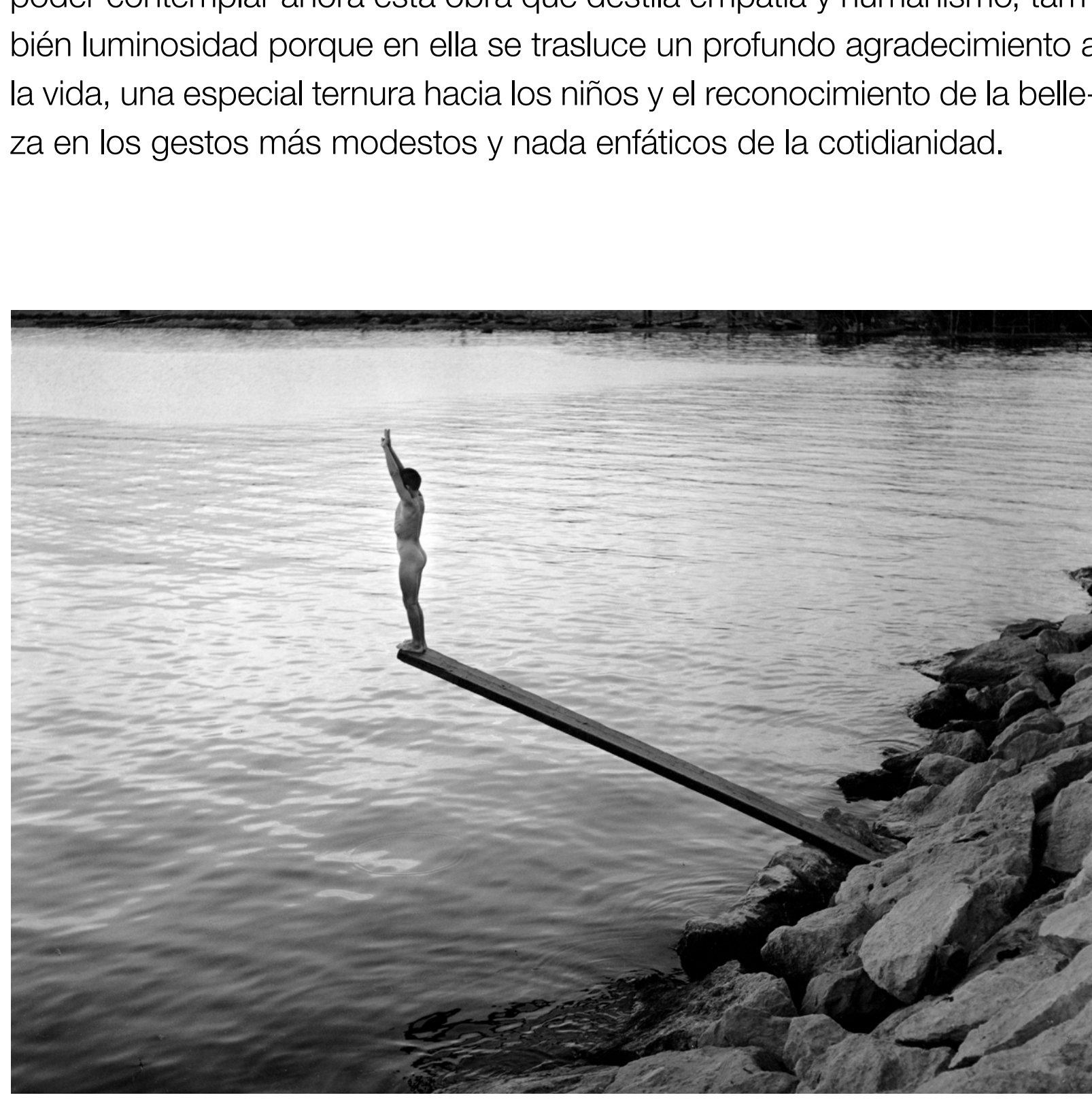
Pequeño atleta. Alicante, 1966