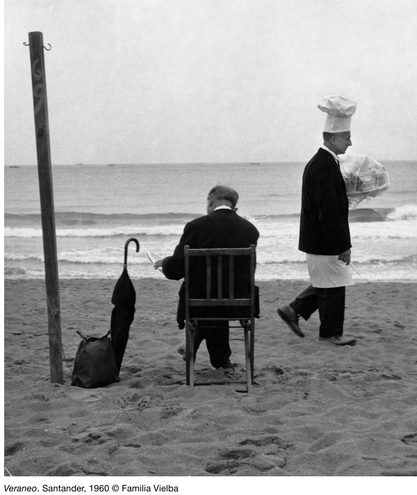
Veraneo. Santander, 1960