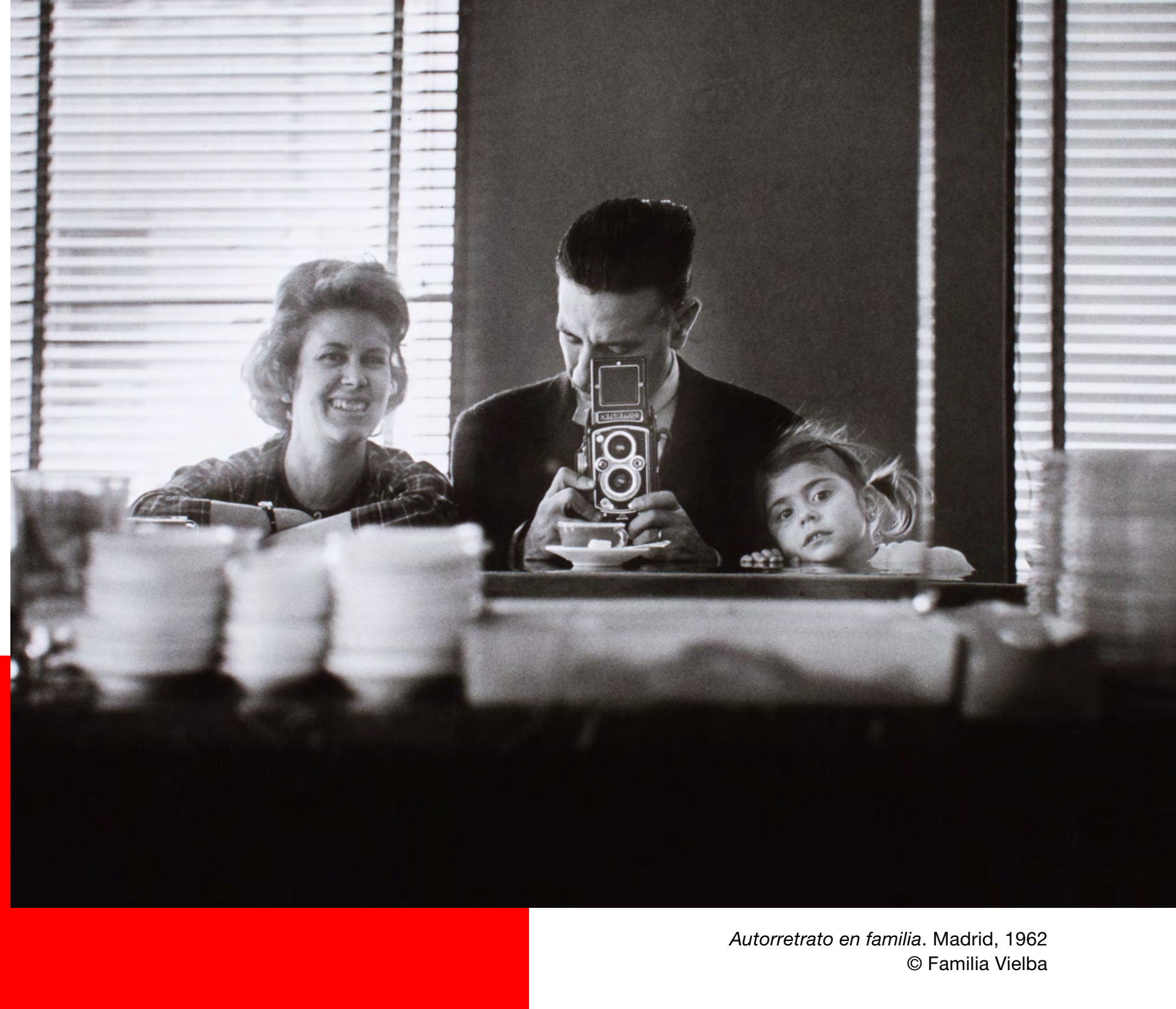
Autorretrato en familia. Madrid, 1962