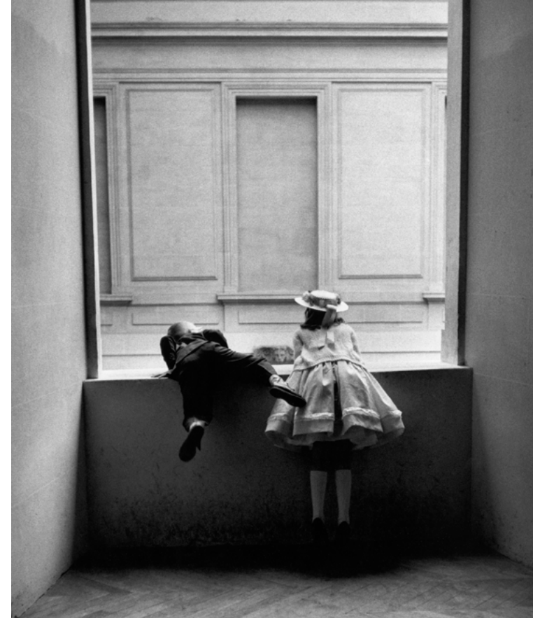
Niños del Louvre. París, 1962