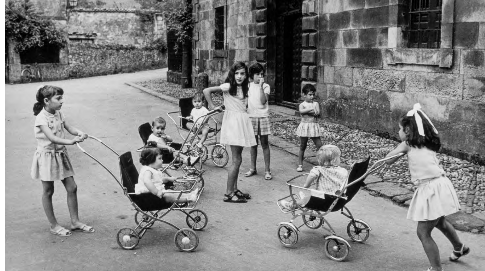
Niñas de Liérganes, Cantabria. 1968

En las primeras décadas de su vida activa, él mismo consiguió romper con sus propios ensayos la barrera de un modernismo algo recargado para dejar emerger un concepto más natural de la belleza y del mundo; nada fácil en un tiempo a menudo marcado por las penurias pero también animado por un gran deseo de salir de la monotonía de los días. Llevó en paralelo su trabajo de profesor en la Escuela Militar de Ingenieros Aeronáuticos con su vocación artística. Estuvo muy influenciado por sus amigos, tanto intelectuales como artistas, y su obra posee una poética llena de autenticidad a la par que una gran sencillez. Mantuvo siempre una gran admiración por poetas y artistas como Juan Ramón Jiménez, Jorge Manrique, Lorca o Eugenio d'Ors; César Manrique fue también un gran amigo suyo. Por su trabajo docente conoció de cerca a José Ortiz-Echagüe y dedicó mucho tiempo al estudio de su obra.