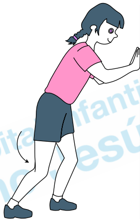
Estiramientos del sóleo