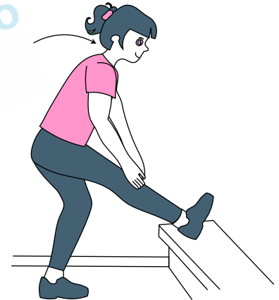
Estiramientos de isquiotibiales