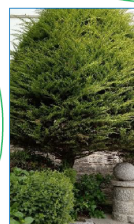
Thuja occidentalis TUYA

Actualmente se han elaborado nueve carteles que se irán ampliando poco a poco, con el fin de realizar un plano con todos los carteles para realizar una ruta guiada por el jardín, dando apoyo al proyecto de hospital saludable, invitando a los pacientes, familiares y usuarios del hospital a caminar por el exterior del centro, disfrutar de la naturaleza y hacer ejercicio