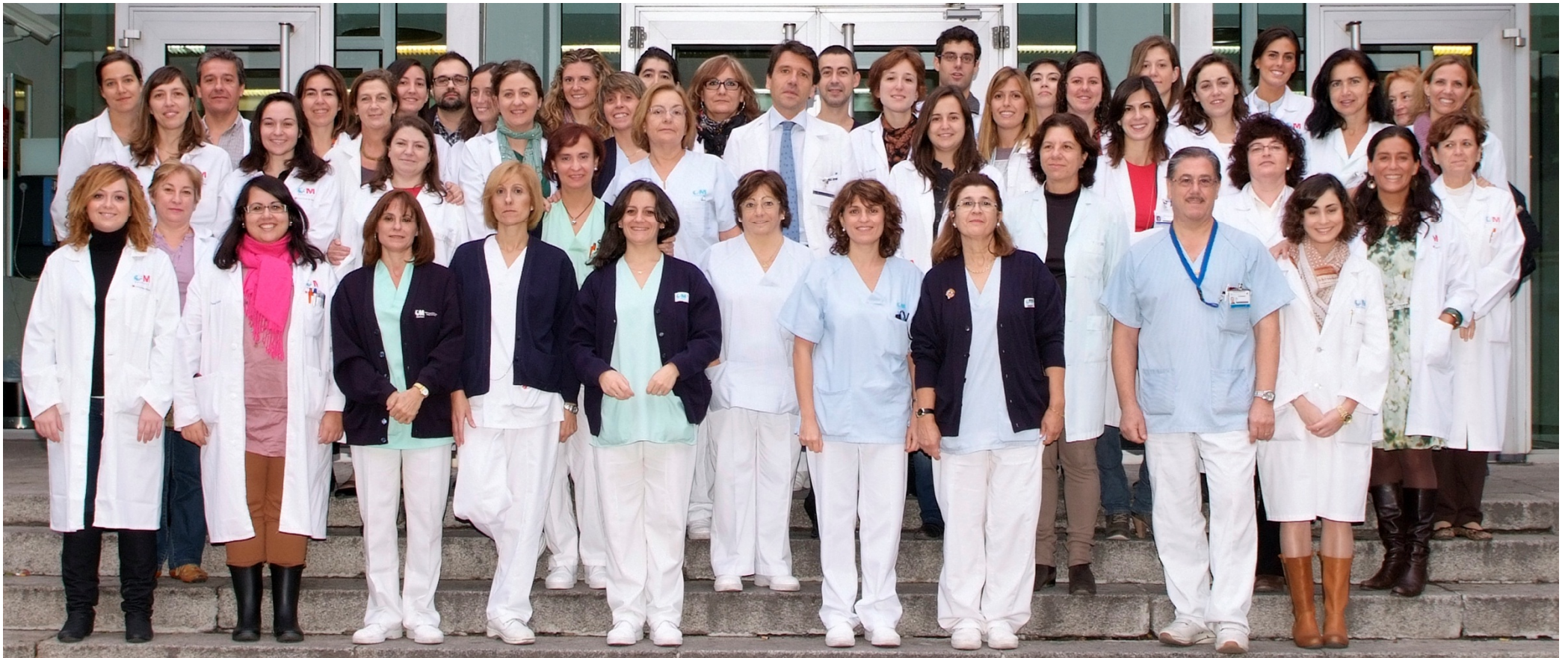
Sección de Psiquiatría del Niño y del Adolescente