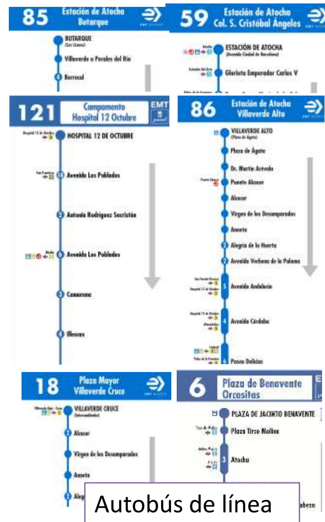
Autobús de línea