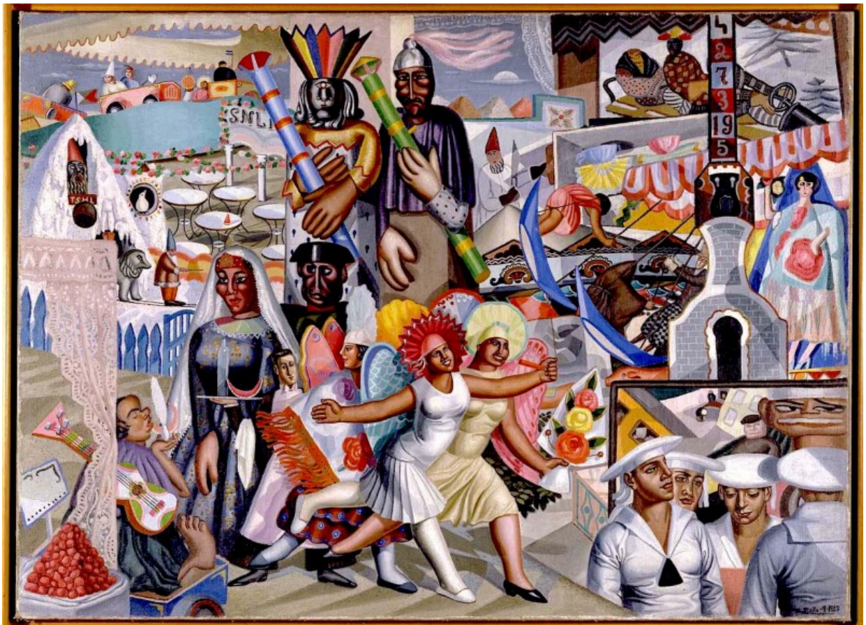
Le Verbena (Maruja Mallo, una de las "sinsombrero" de la generación del 27, 1927)