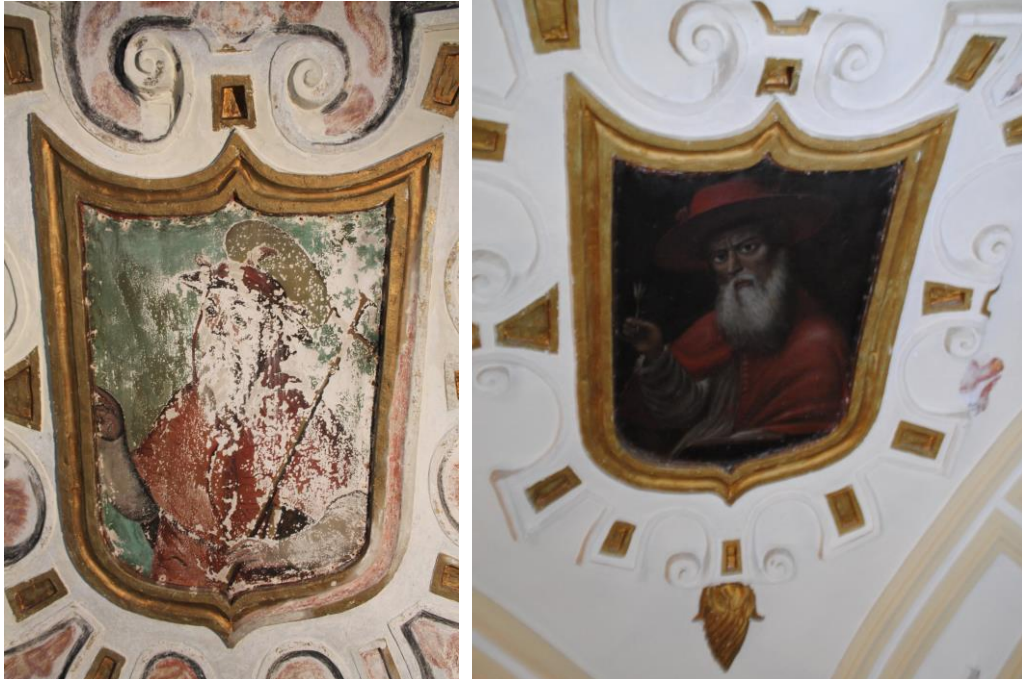
Pintura mural y lienzo sobre puesto en su lugar

consolidación y pérdidas a causa de la eclosión de sales arrastradas por la filtración de humedad que tuvo lugar en el pasado en la bóveda.