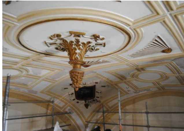
Repinte blanco y crema generalizado en el total de la bóveda

Iglesia Parroquial de Ntra. Sra. de la Asunción de ALGETE (Madrid)