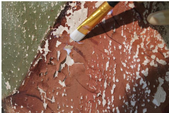
Aplicación de consolidante

Se ha realizado la examinación pormenorizada del estado de consolidación del estrato pictórico evaluando y proponiendo los materiales y metodología de intervención para su consolidación. Así se determinó el tipo de consolidante adecuado y el disolvente que actuará como vehículo del consolidante.