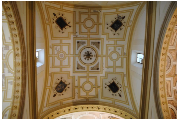
Imagen de la bóveda previa a la intervención