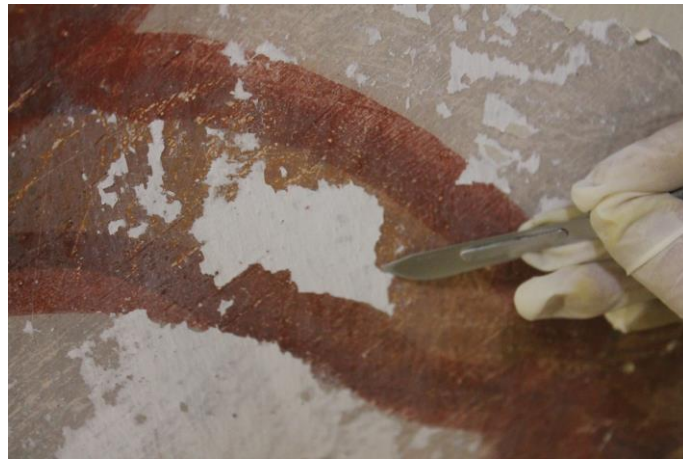
Eliminación de repintes