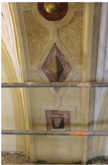
Proceso de eliminación de repinte, limpieza y saturación