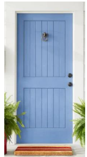
Blue book (prácticas)