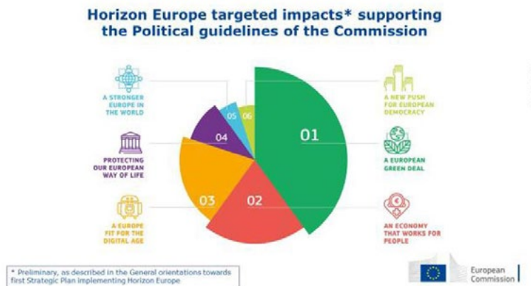
Gráfico 3.

Los resultados del proceso de codiseño se resumen en el documento Orientaciones hacia el primer Plan estratégico para Horizon Europe .