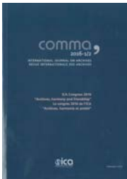
Table des matières Table of contents