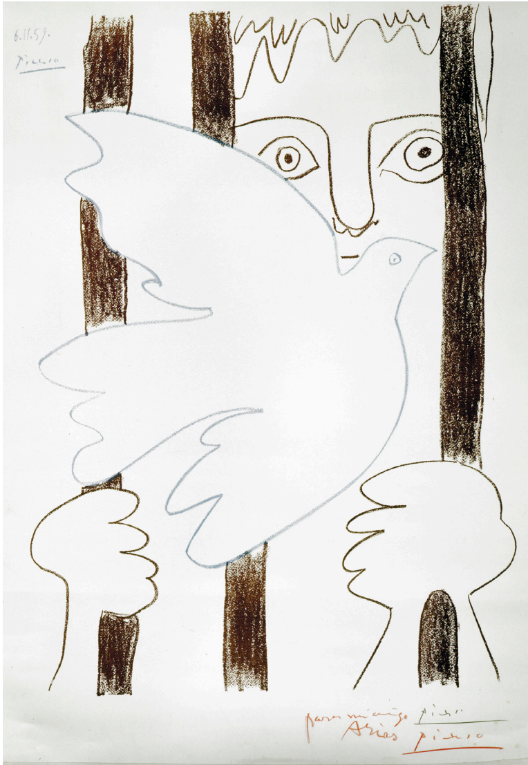
“Preso con paloma de la paz”, de Picasso.