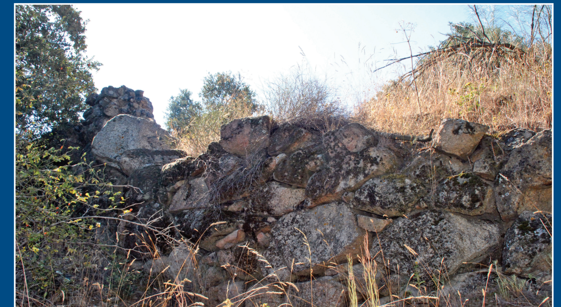
Aspecto del muro de contención.