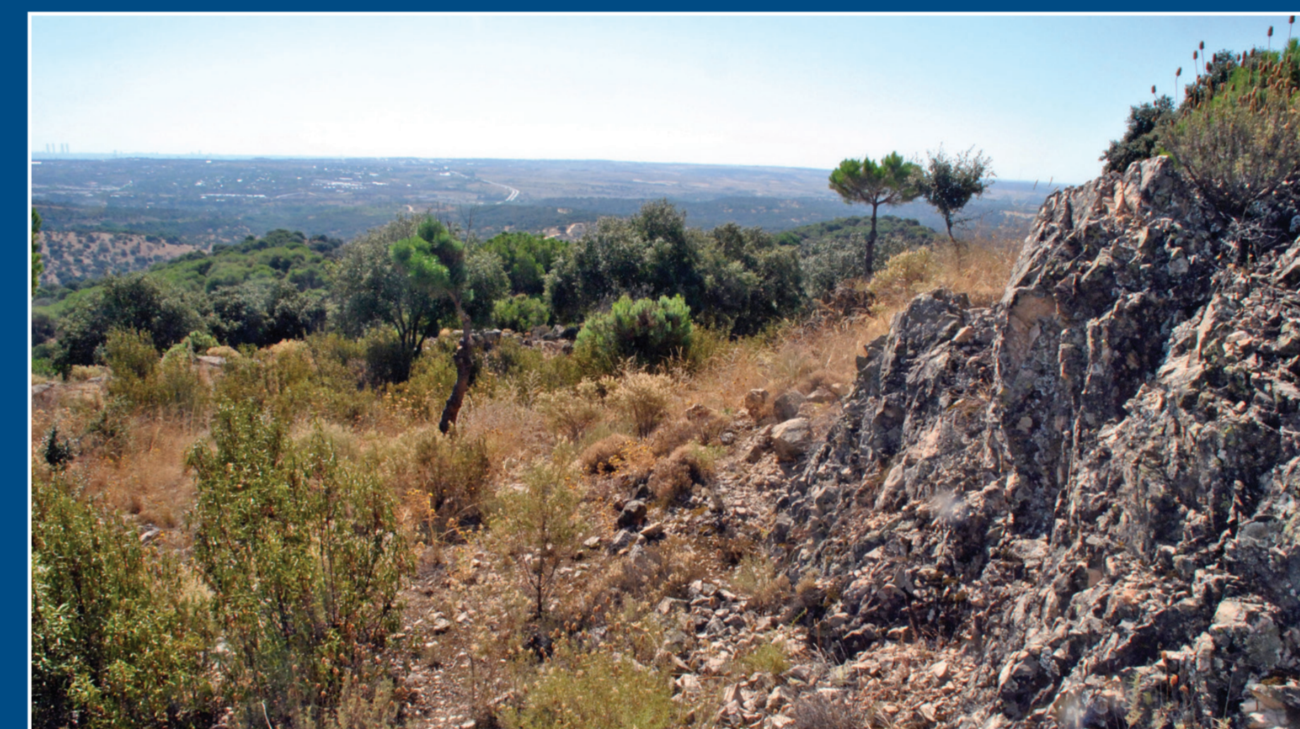
La caja del camino, tallada en la roca.

Como podemos observar, en este lugar se conserva aún un buen tramo de camino, tallado en la roca por el lado interior y con su paredón de sustentación por el lado exterior.