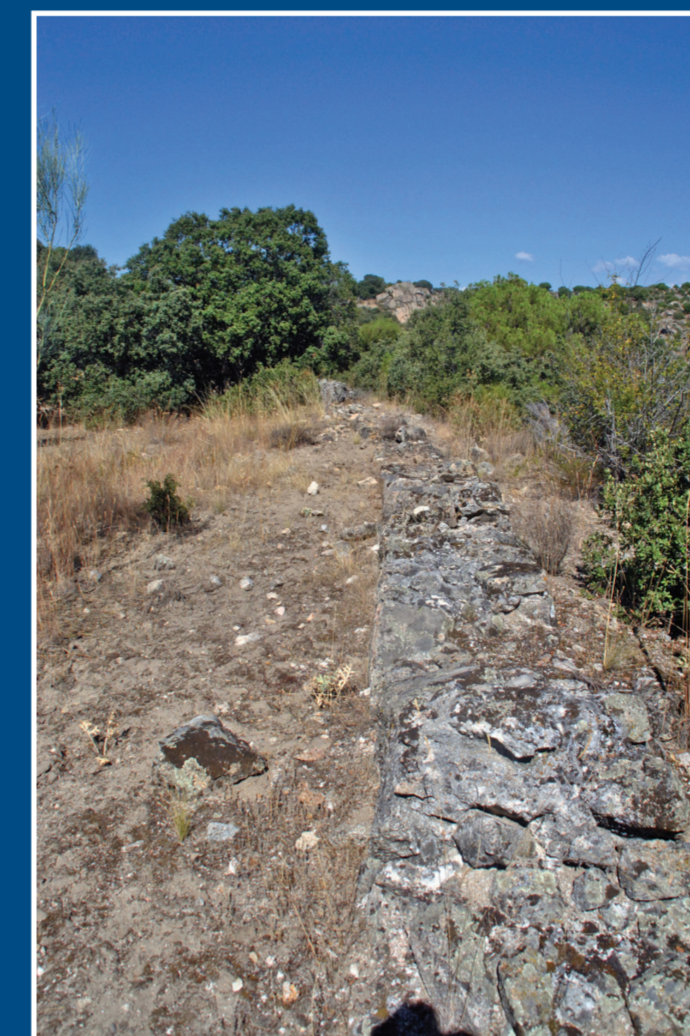
El muro de sustentación o paredón.

Marcos de Viena, Comisario General de Obras Públicas en los reinados de Fernando VI y Carlos III, tuvo que hacerse cargo de su reparación, ampliando a 20 pies (5,6 metros) su anchura.