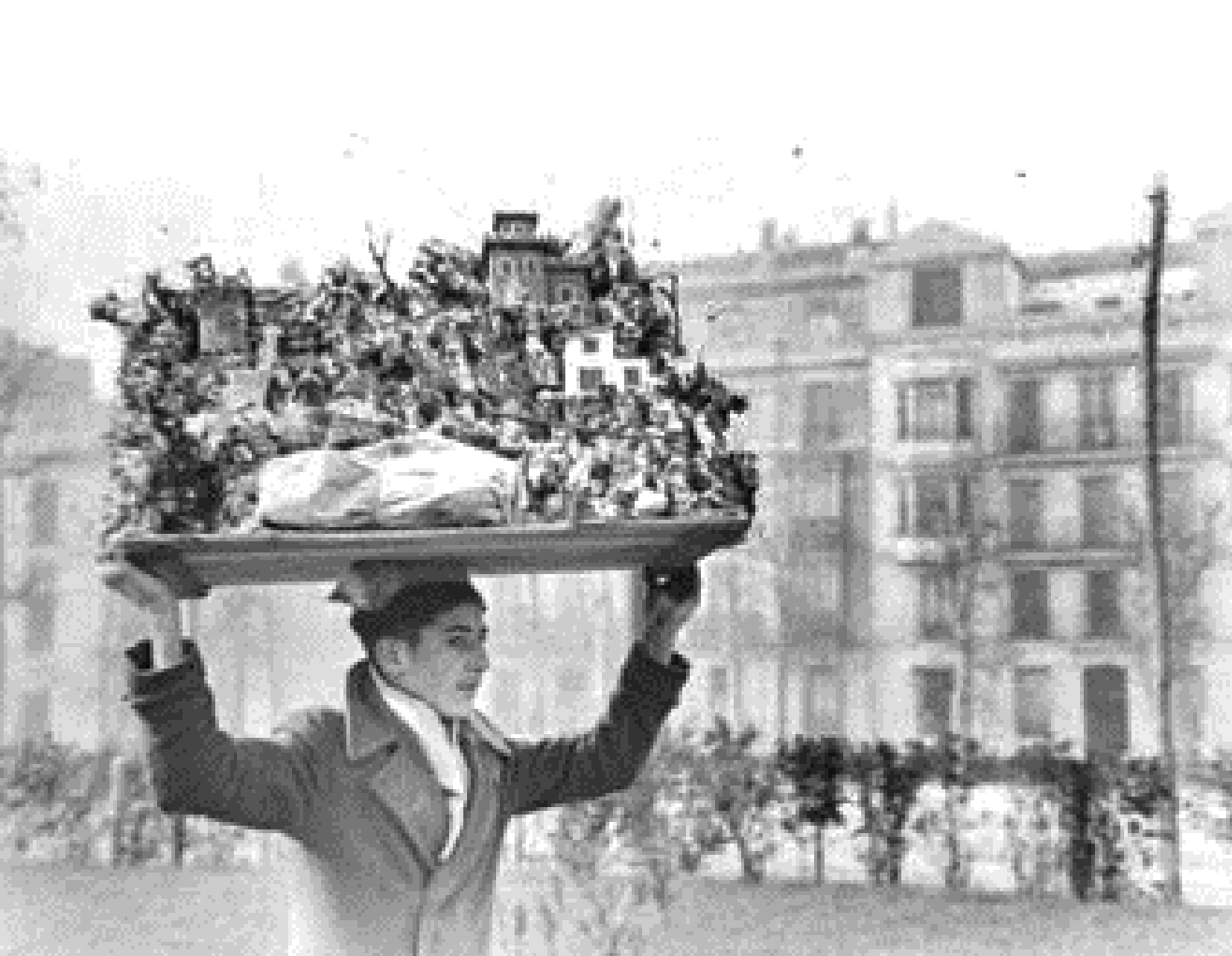
1941. TRANSPORTANDO UN NACIMIENTO.