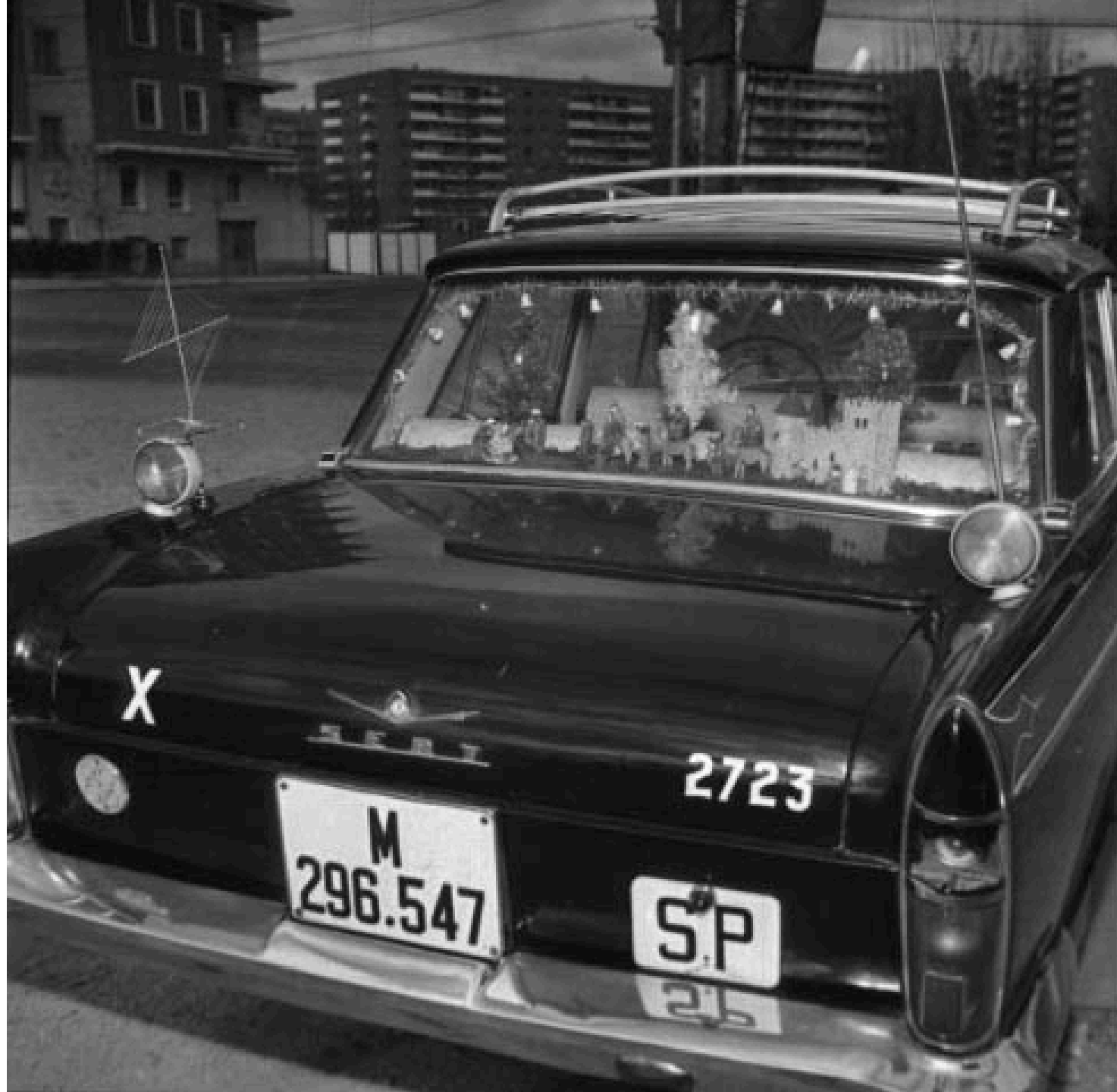
1963. UN TAXI CON BELÉN EN LA BANDEJA TRASERA.