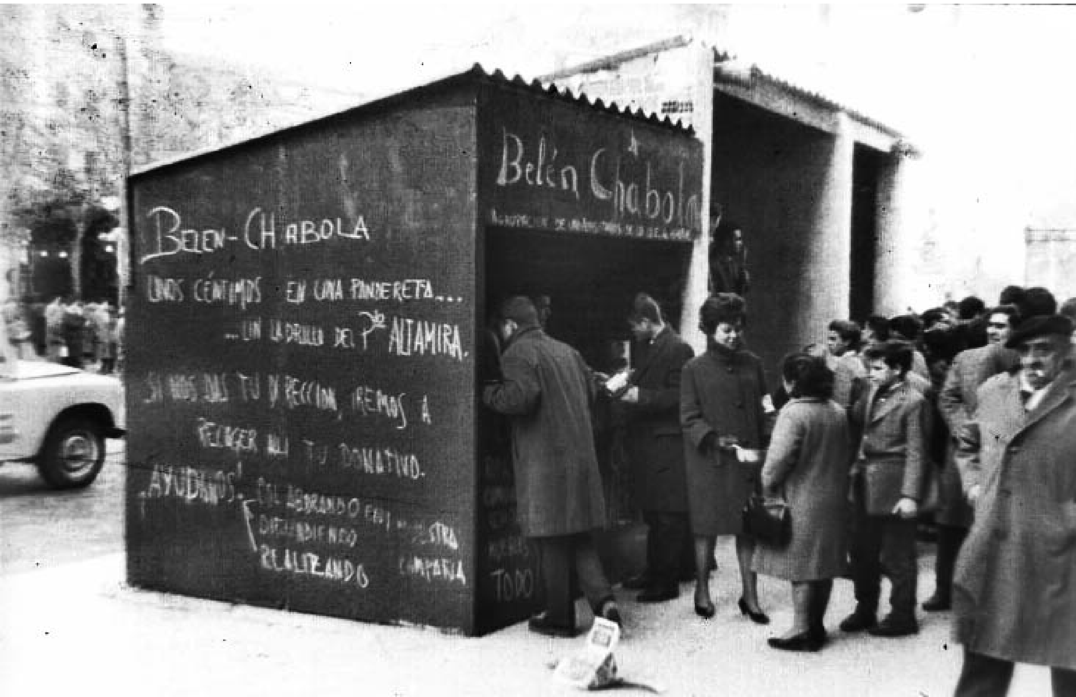
1962. BELÉN CHABOLA EN LA GLORIETA DE QUEVEDO.