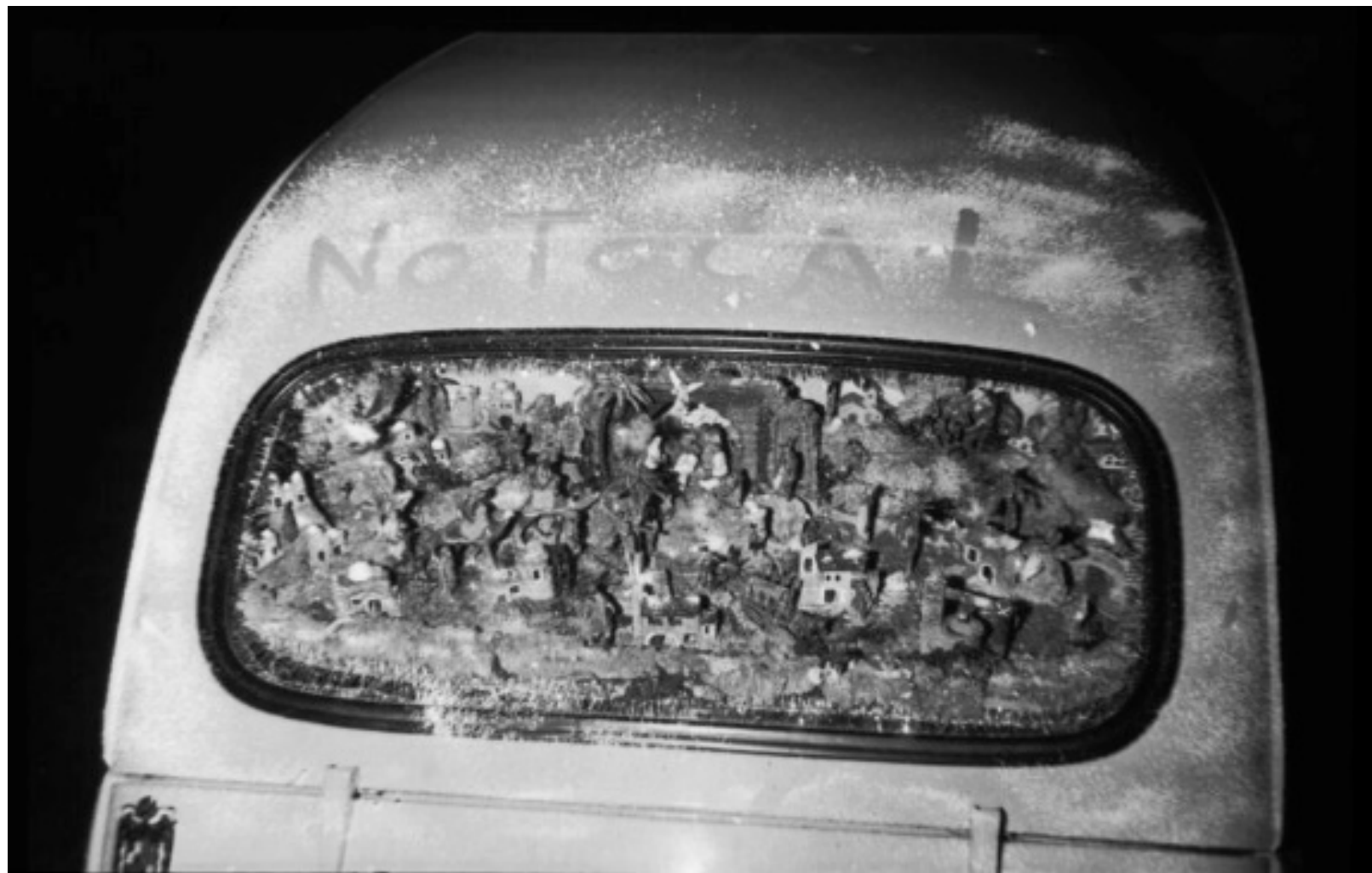
1966. NACIMIENTO EN LA PARTE TRASERA DE UN 'SEISIENTOS'.