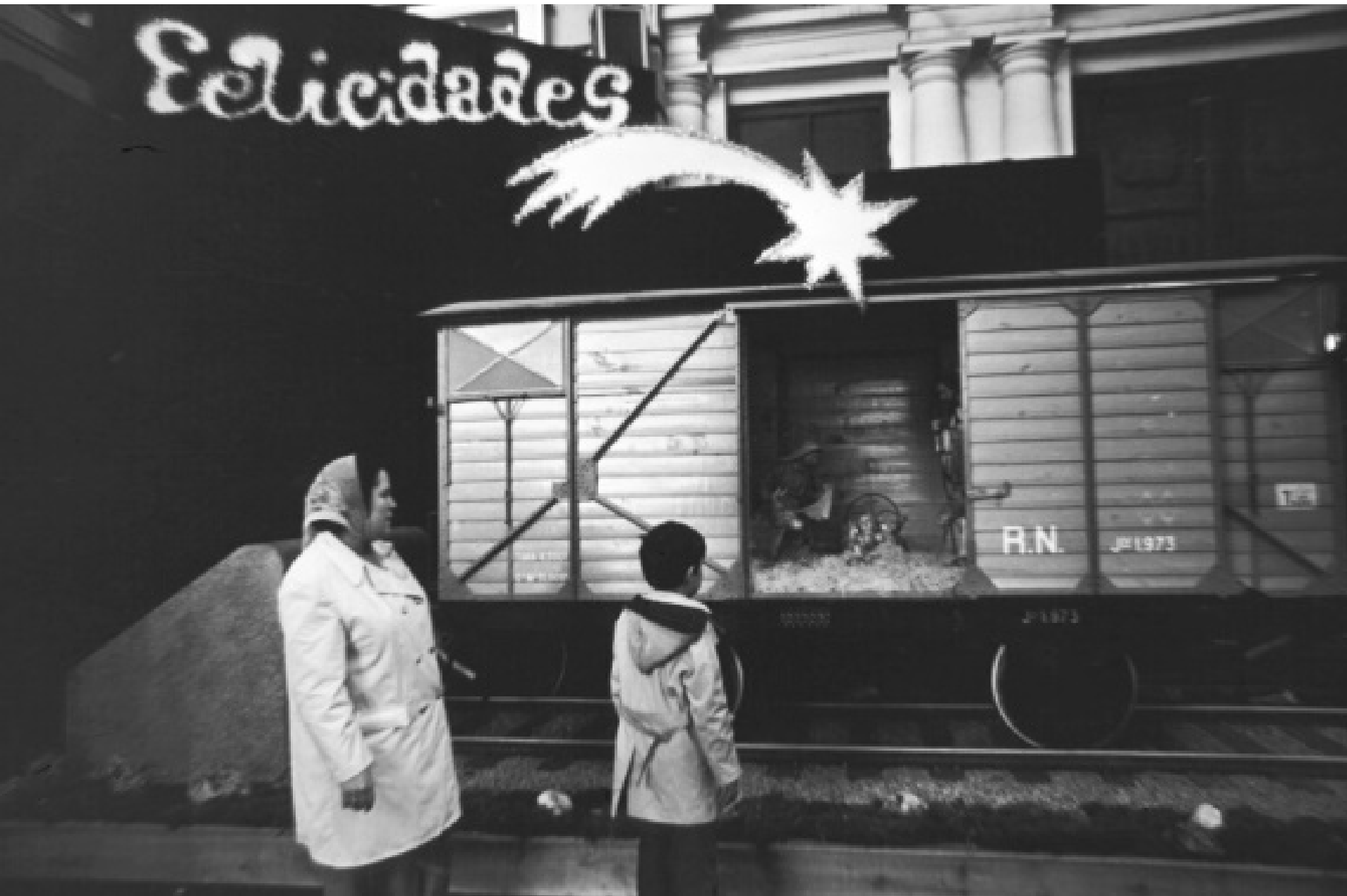
1973. BELÉN EN UN VAGÓN DE LA ESTACIÓN DE NORTE.