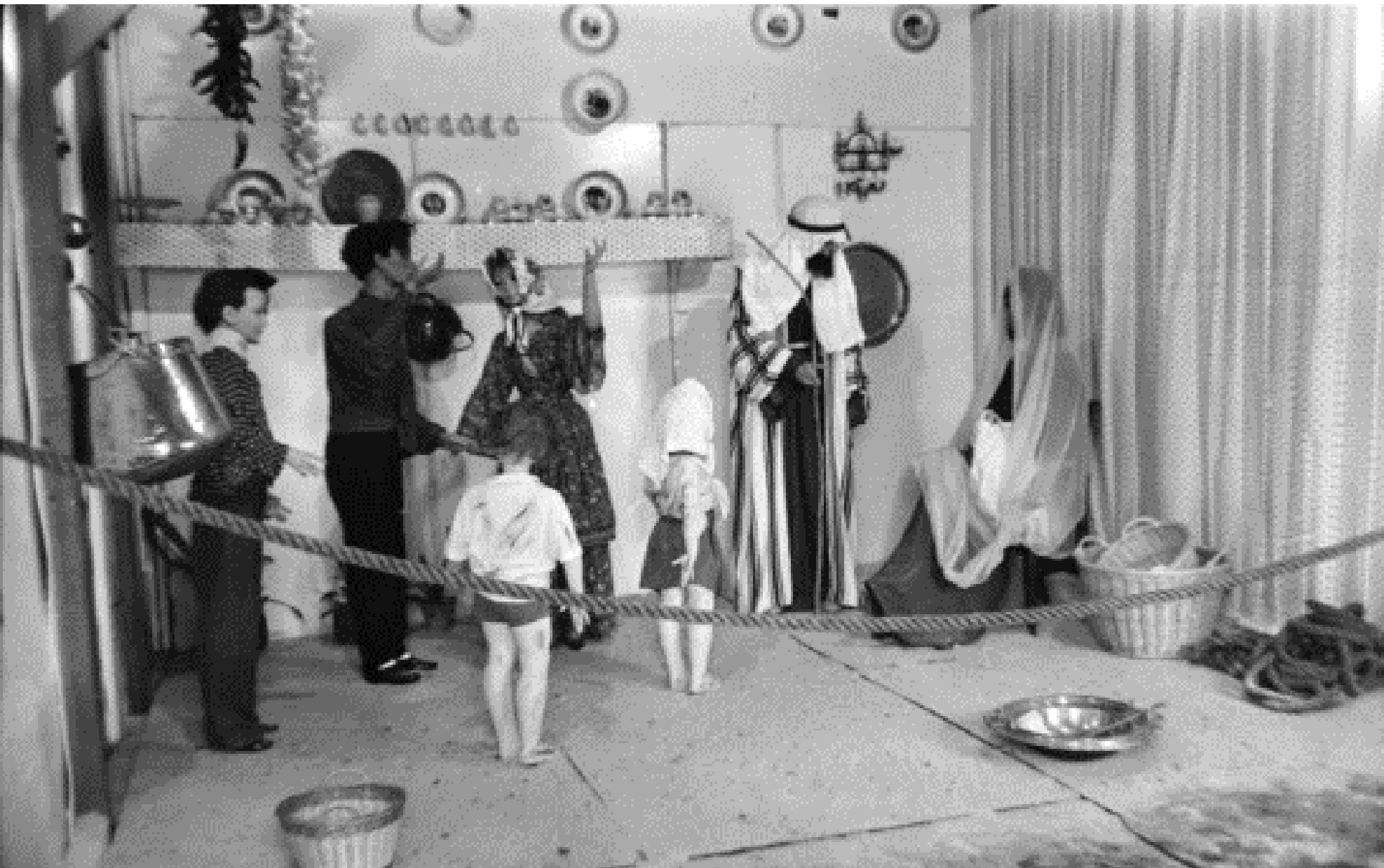
1965. BELÉN GITANO EN CIBELES.