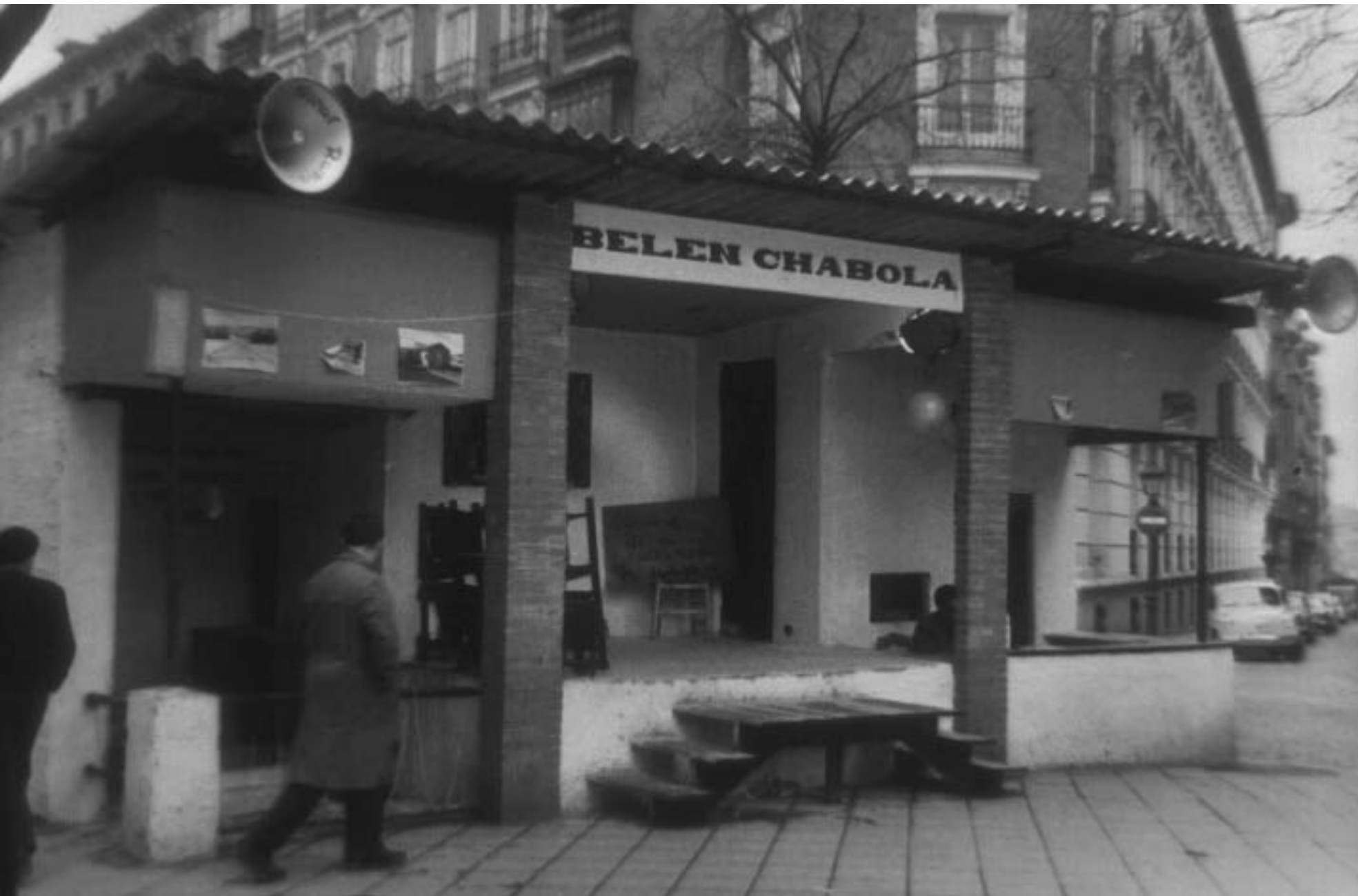
1961. BELÉN CHABOLA EN LA GLORIETA DE BILBAO.