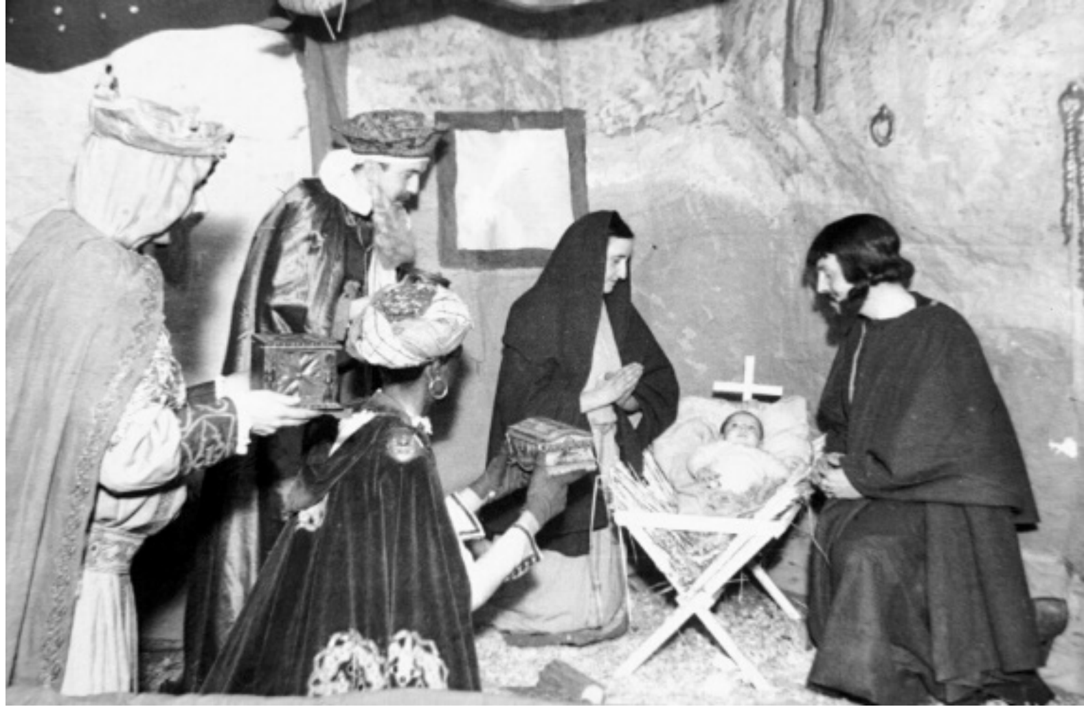
1942. REPRESENTACIÓN MÍMICA DEL NACIMIENTO DE JESÚS.