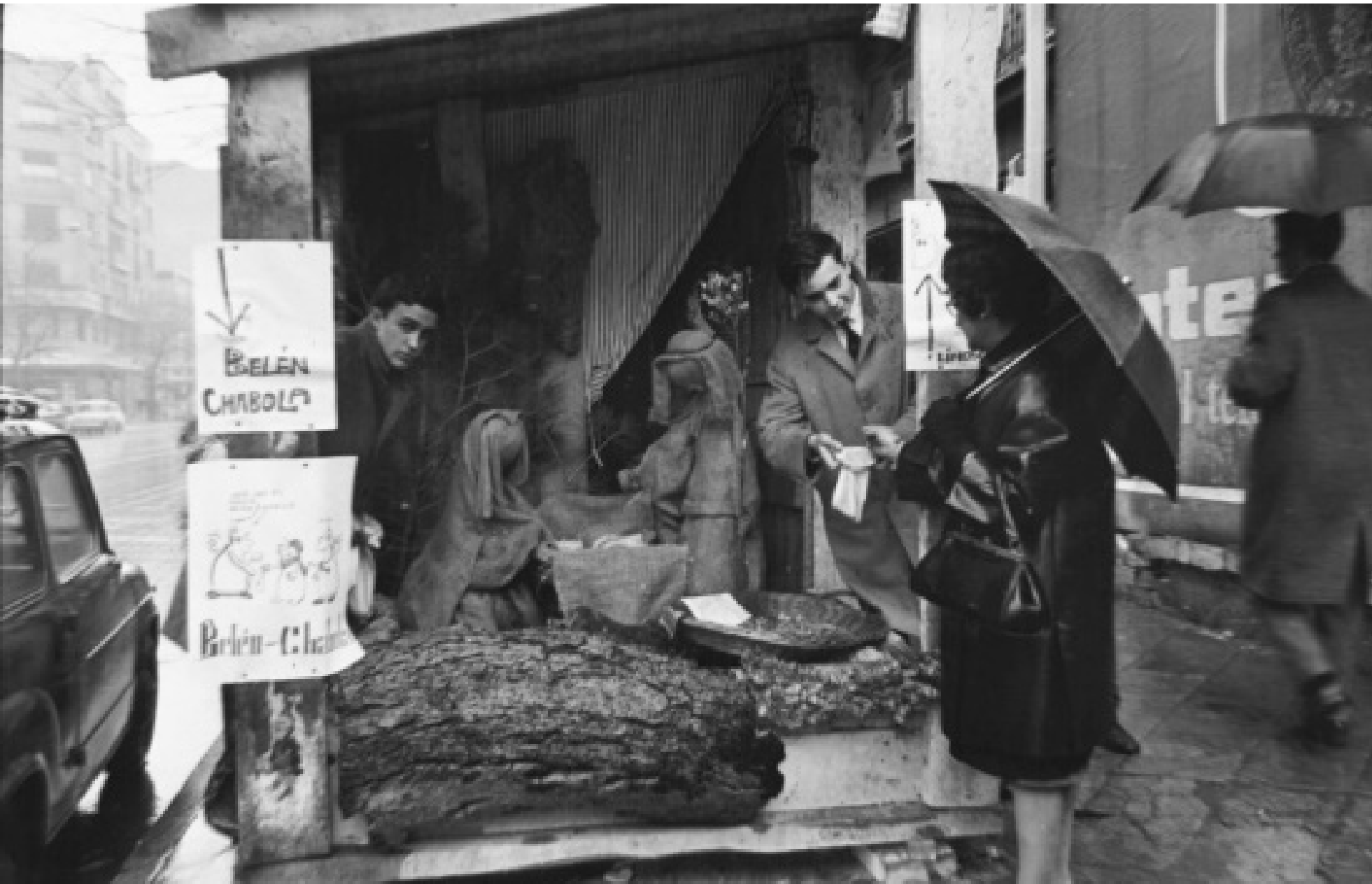
1965. BELÉN GITANO EN CIBELES.