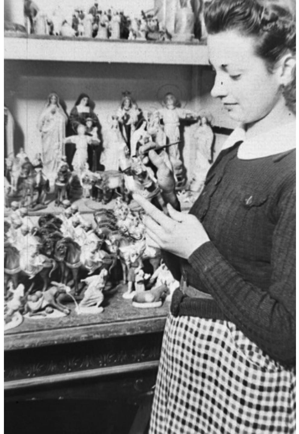
1940. CONFECCIÓN DE FIGURITAS PARA NACIMIENTOS. FONDO FOTOGRÁFICO MARTÍN SANTOS YUBERO. ARCM.