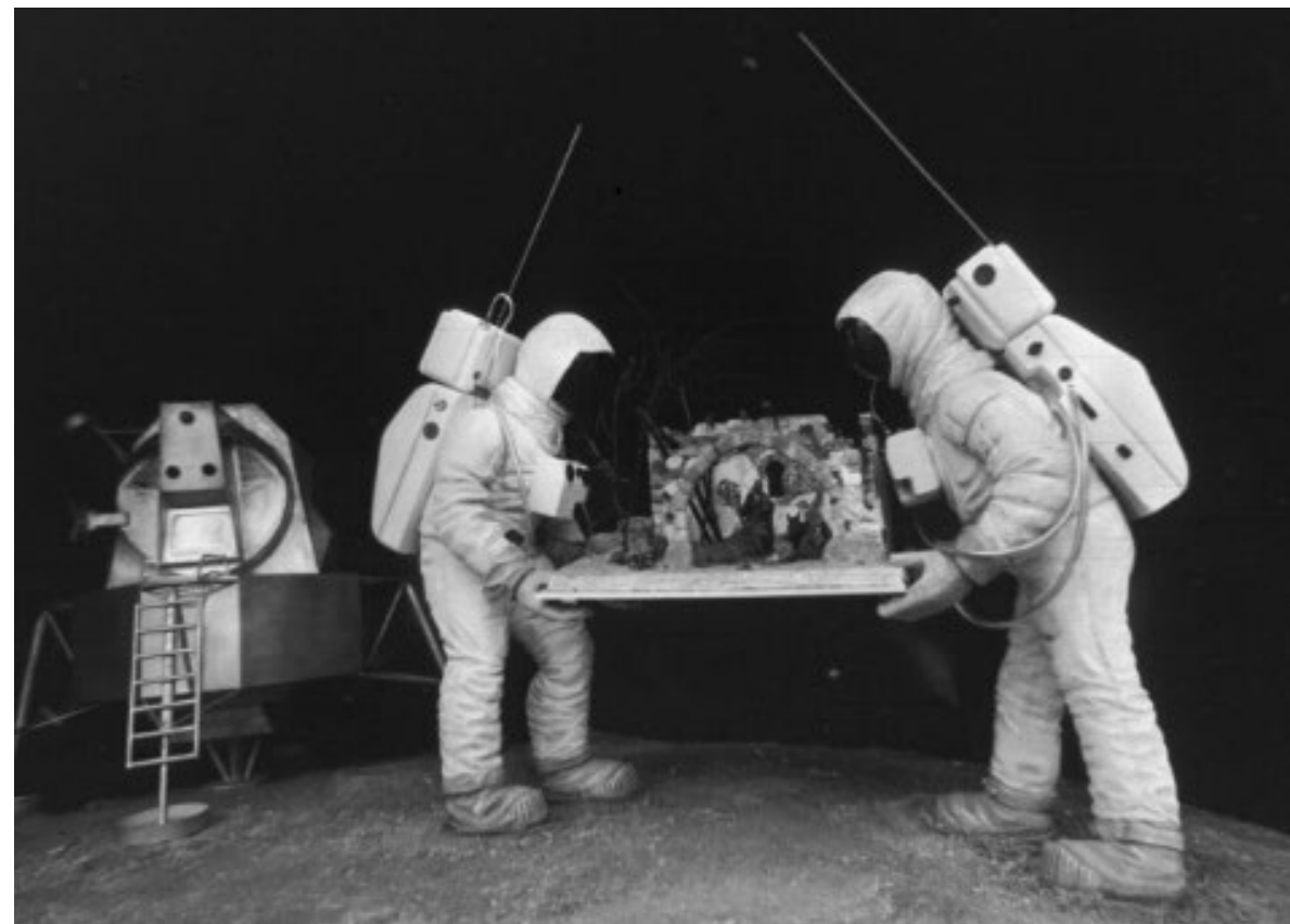
1969. NACIMIENTO CON COSMONAUTAS EN LA PLAZA DE SANTA ANA.