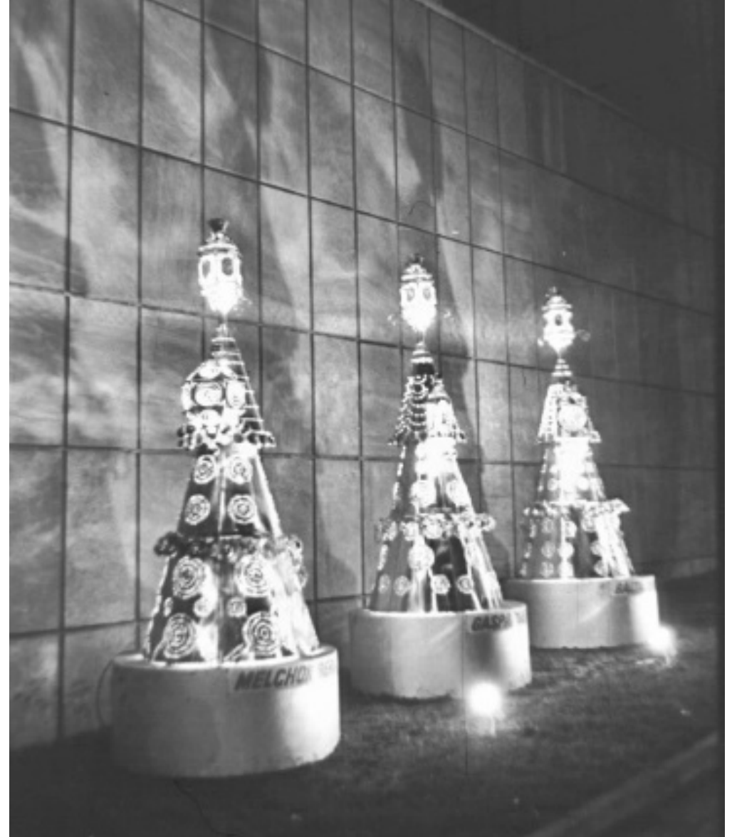
1969. BELÉN DE LATÓN DE LA COMPAÑÍA IBERIA UBICADO EN EL EXTERIOR DE SU SEDE DE MARÍA DE MOLINA. A LA IZQUIERDA, EL PORTAL Y, A LA DERECHA, LOS TRES REYES MAGOS.