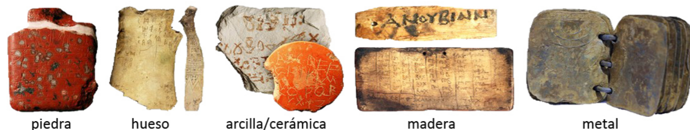
piedra hueso arcilla/cerámica madera metal

Para poder escribir, además de la propia escritura, necesitamos un soporte en el que plasmarla. A largo de la historia se han utilizado para ello distintos materiales: piedras, hueso, metales, arcilla, corteza de árboles, madera, hojas vegetales, tabillas de cera, papiro, pergamino y papel.