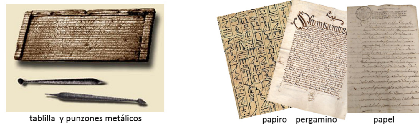
tablilla y punzones metálicos papiro pergamino papel